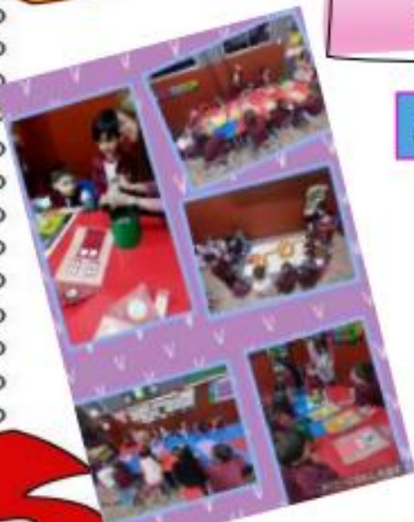
JUEGOS DE SECREDO