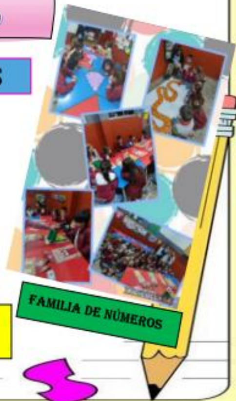
FAMILIA DE NÚMEROS

Para seguir estando juntos... La Escuela en acción